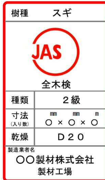
人工乾燥処理下地用製材