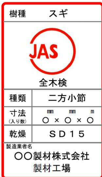
人工乾燥処理造作用製材