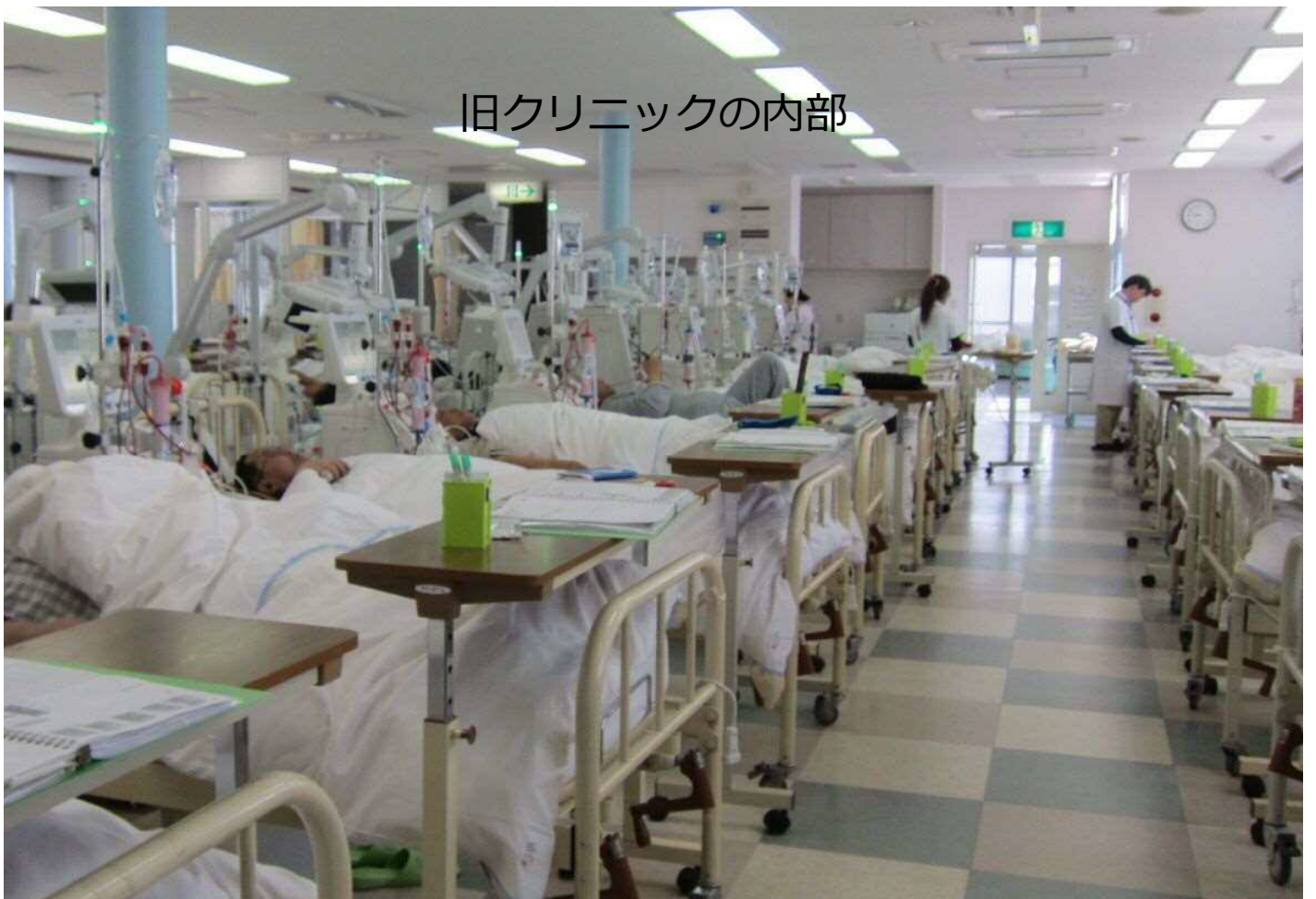
旧クリニックの内部