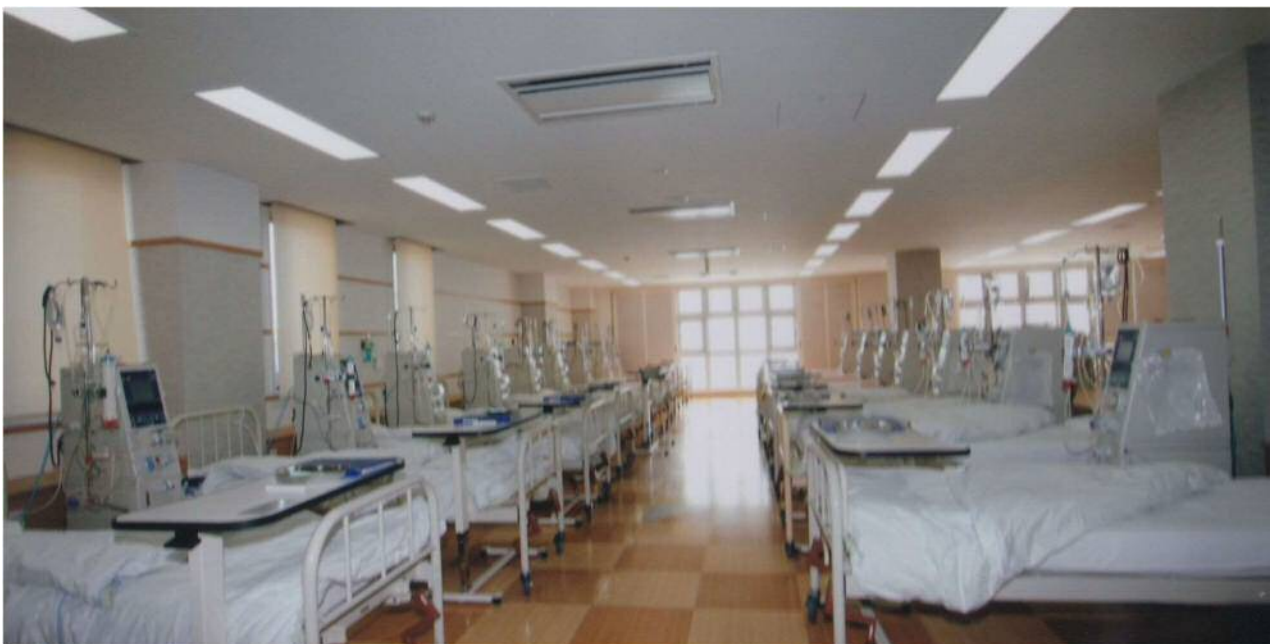
H20年建築の当院分院とテイストが変 23