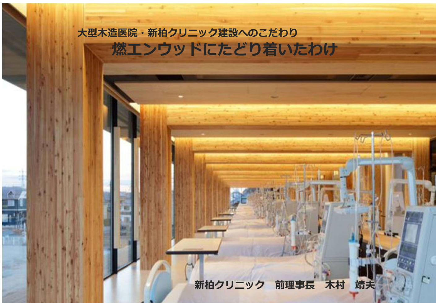
新柏クリニック 前理事長 木村 靖夫