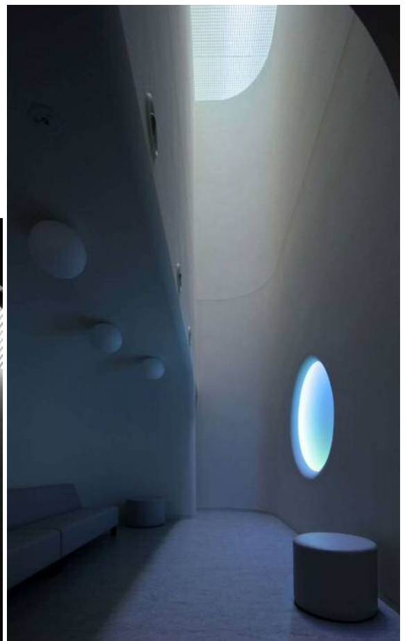
待合室は「湧き出る水」