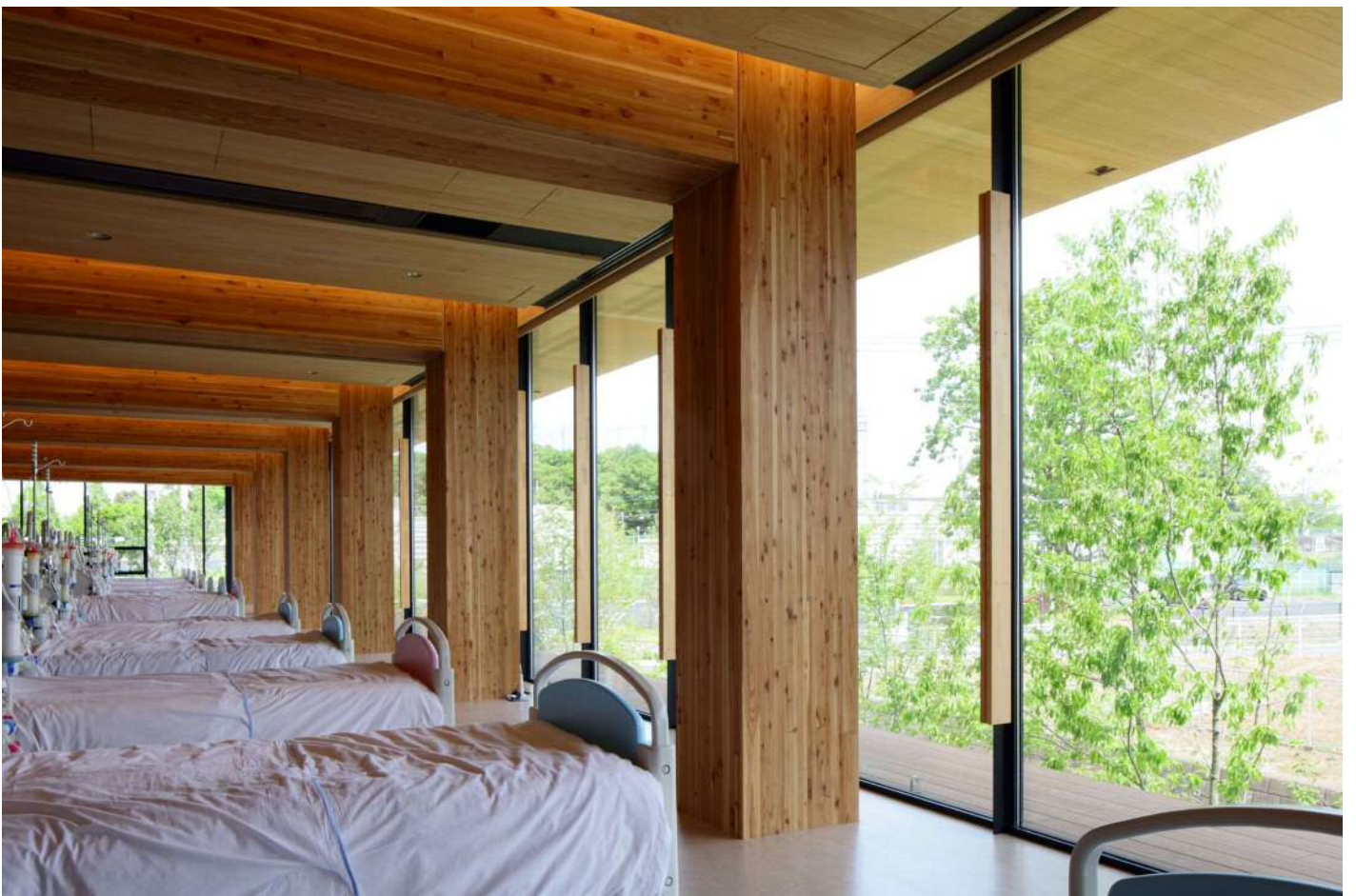
大黒柱がいっぱいの森林浴のできる透析室 29