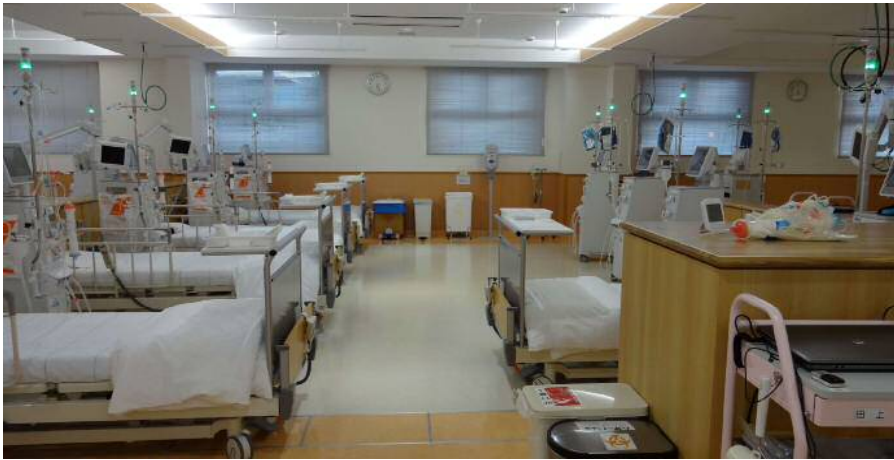
契約した会社が設計した病院の透析室 先ほど最後の見学例