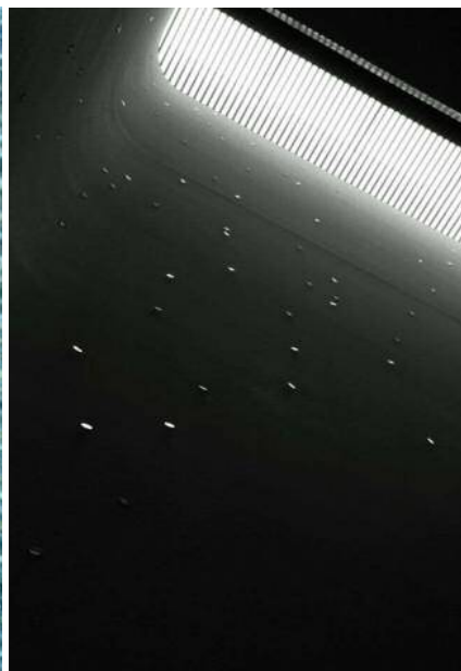
待ち合室脇の階段「ふりそそぐ光」