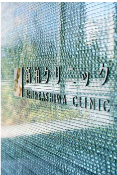
森の緑をうつしこむ「たゆむ水」