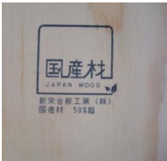
日本合板工業組合連合会 (新栄合板工業(株))