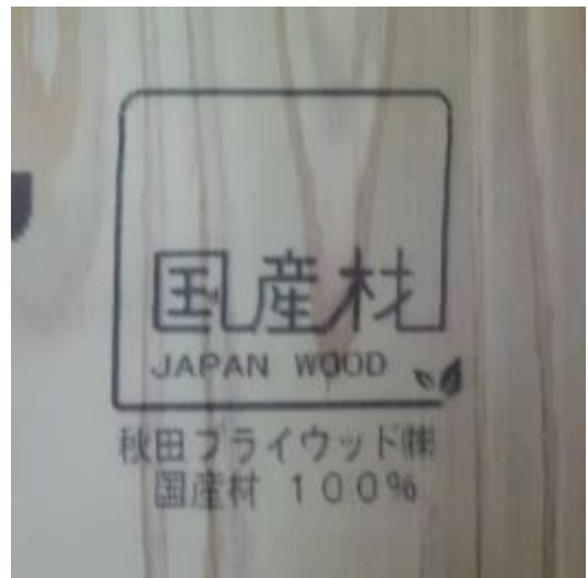
秋田プライウッド(株)