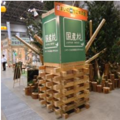
ナイス(株) (展示会のサイン看板でのPR)