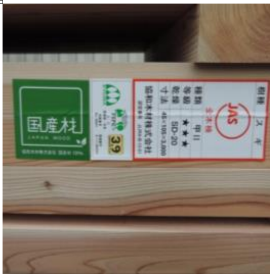
協和木材株式会社