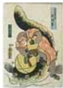
鯰(なまず)について

耐震化住宅を5%以内」とする目標を打ち出しました。この目標値は、遅々として進まない住宅の耐震化を見ると現実的ではないという指摘があります。実際、数十万戸の目標を掲げながら、10年間でその数%しか達成されていない県もあります。想定される大地震を考慮すると、この停滞がもたらす結果は歴然としています。哲学と理念、制度と運用、技術と手法、果たすべき職能と役割が問われており、目標実現のために、各界各人の総力の結集が、緊急に求められています。