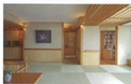
4. マンションの改修