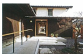
2. 住宅の高齢者対応改修