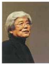
「木の家」耐震改修推進会議 議長 委老孟司 (東京大学名誉教授)