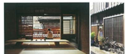
豊崎長屋: 大阪市立大学 竹原・小池研究室